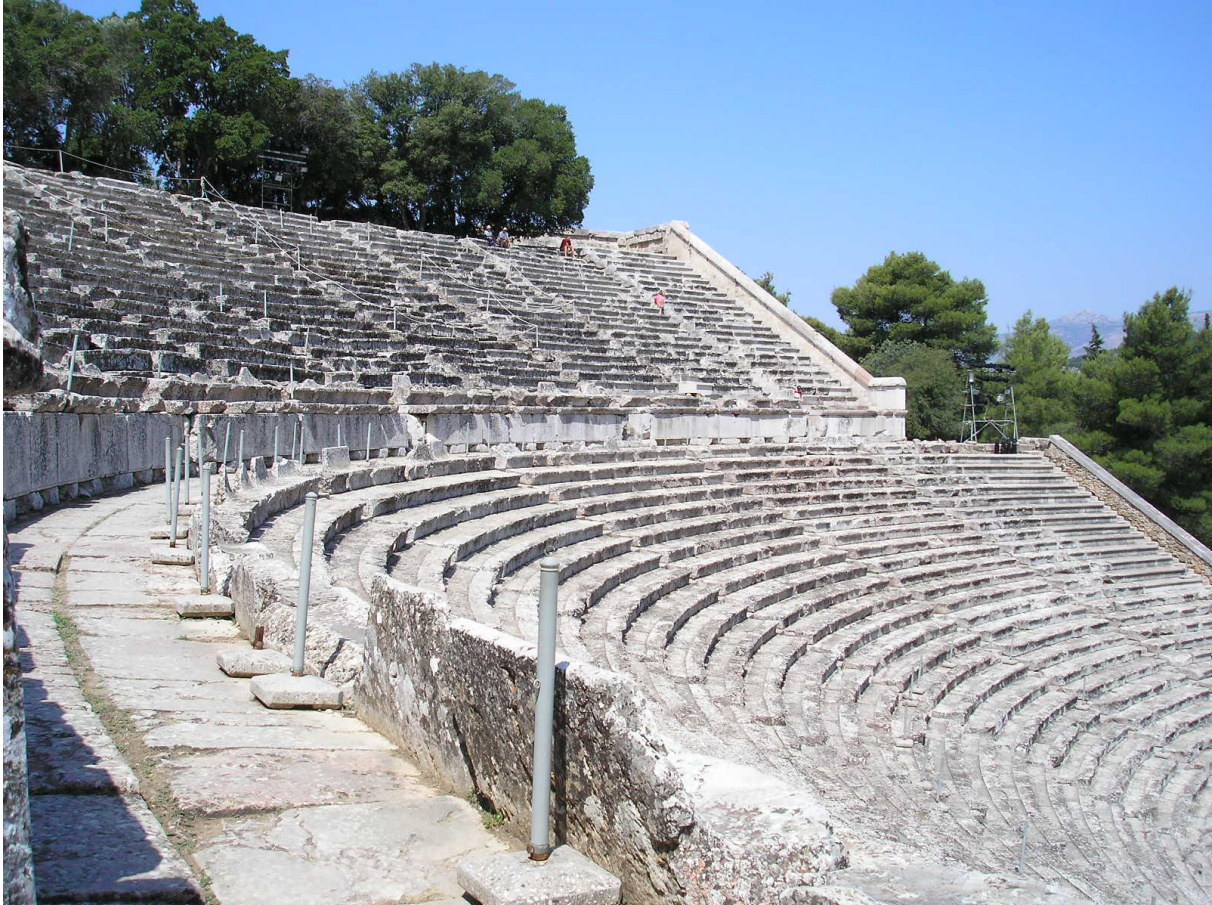
Az epidauroszi színház

A hellénisztikus Kis-Ázsia túlságosan kedvelte a pompát, és hajlott a gigantikus méretek alkalmazására. Ugyanez a méretbeli nagyság jellemzi szobrászatát, amely ugyanakkor képtelen az i. e. V–IV. század folyamán kialakult típusok továbbfejlesztésére. Figyelembe kell venni azonban, hogy a hellénisztikus kor művészetének megítéléséhez többségében csak viszonylag kisebb jelentőségű városok szolgáltatnak bővebb adatokat. Nagy Sándor hadvezéreinek fővárosaiból semmit sem ismerünk, pedig ezek lehettek a művészeti tevékenység igazi központjai.