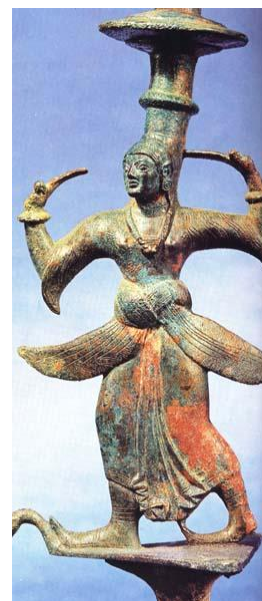
Táncosnőformájú bronz kandeláber

Gazdag vas-, ón- és rézlelőhelyeinek köszönhetően Etruria fémkohászata igen fejlett volt. Az etruszkok kiváló bronzszobrászoknak bizonyultak. Tehetségük nemcsak nagyméretű alkotásokban nyilvánult meg; a legkisebb tárgyak esetében is képesek voltak összeegyeztetni a művészi célt és a gyakorlati hasznosságot.