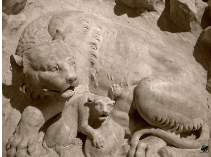
Grimani relief, oroszlán a kölykeivel

Lehetséges viszont, hogy a rómaiak az etruszkoktól vették át az amfiteátrumban űzött játékokat, amelyeket az etruszkok talán Kis-Ázsiából hozhattak magukkal. Az biztos, hogy a gladiátorviadatok már akkor megjelentek Rómában, amikor a hellénisztikus szokásokat még fenntartásokkal fogadták. Agrippa felépíttette híres fürdőit. A Claudius által építtetett hatalmas vízvezeték romjaiban is Róma környékének egyik fő látványossága. Nero a Mons Vaticanuson cirkuszt emeltetett, és ő volt annak a fényűző, kertes palotának az építtetője is, amely Aranyház néven egészítette ki a császárok rezidenciáját.